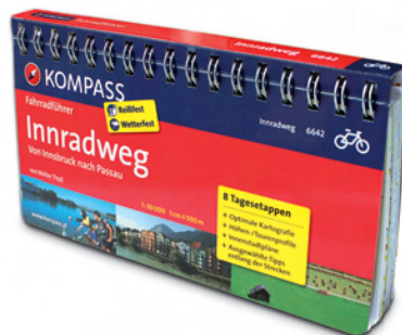
* Stand: Druckauflage 2011.