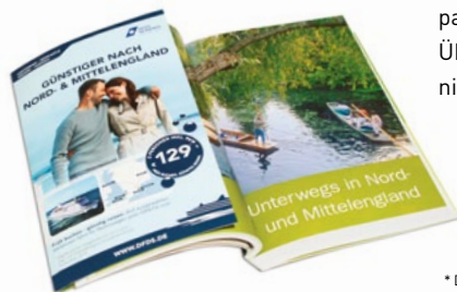
Ausklappbare 2. US

Zur Zielgruppe zählen die anspruchsvollen Individualreisenden. Qualität genießt bei ihnen einen hohen Stellenwert. Die Leser sind auch aufgrund ihres hohen Einkommens gerne bereit, in hochwertige Markenprodukte und besondere Dienstleistungen zu investieren.*