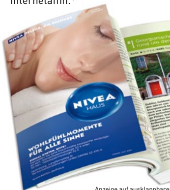
Anzeige auf ausklappbarer 2. US als Lesezeichen

Zielgruppe sind insbesondere die Liebhaber von Kurzurlauben und Städtetrips, die in den wenigen Urlaubstagen viel erleben möchten. Sie sind aktiv, modern und internetaffin.*