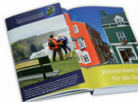
Ausklappbare 2. US

Sortimentsbuchhandlungen Warenhaus Kiosk Sonderverkäufe