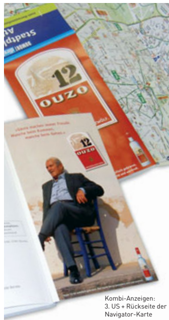
Kombi-Anzeigen: 3. US + Rückseite der Navigator-Karte

Zielgruppe sind insbesondere die Liebhaber von Kurzurlauben und Städtetrips, die in den wenigen Urlaubstagen viel erleben möchten. Sie sind aktiv, modern und internetaffin.*